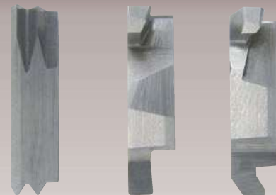
特殊チップ側面写真 Special inserts (side)